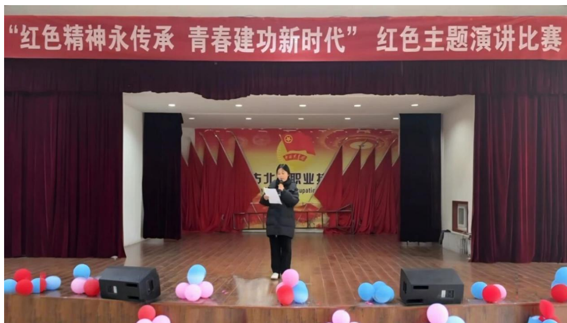
图 4-2 “红色精神永传承, 青春建功新时代” 红色主题演讲比赛

此次比赛不仅为学生提供了展示才华、交流思想的平台,更是一堂深刻的思政教育课,让红色文化在校园广泛传播,红色基因在青年心中扎根。未来,学院将持续丰富红色文化活动形式,引导青年以红色精神为指引,在青春赛道上勇毅前行,让青春在新时代建功实践中绽放绚丽之花。