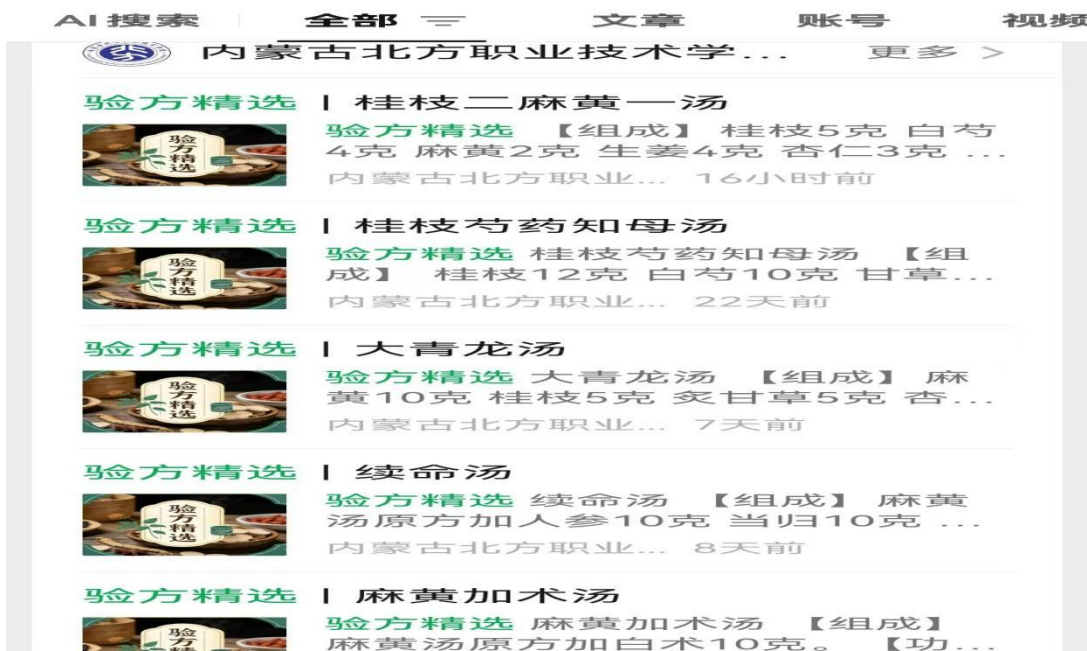
图 3-3 公众号宣传中药知识

艾绒并且卷制艾条，激发读者的学习兴趣。中医药文化的传播要用人们看得见、听得懂、用的会的方式，通过多方面、多角度、多形式来传播中医药文化，提高全民的健康意识。