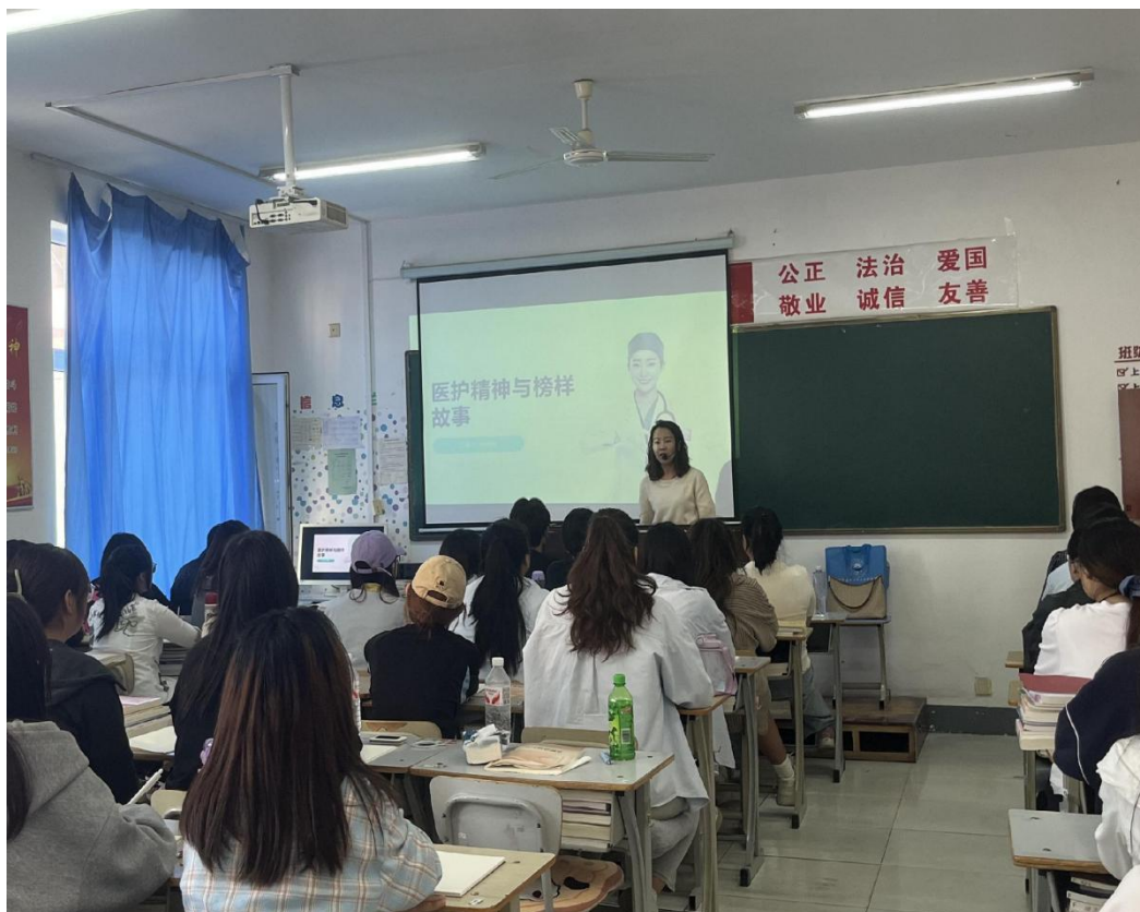
图 2-1 老师讲解名人事迹