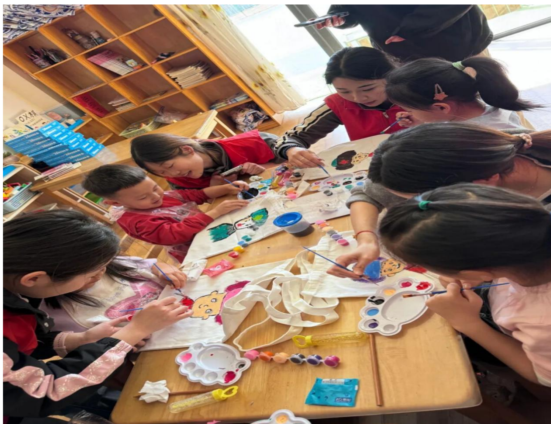
图 4-5 小朋友在绘制自己心中的雷锋图像

近孩子心灵的语言讲述雷锋叔叔的故事——帮战友补衣、扶老奶奶过马路……孩子们听得入神，眼中满是崇敬，纷纷拿起画笔，如同肩负神圣使命，郑重地在帆布包上落下每一笔。有的画出雷锋叔叔挺直的脊梁与温暖的笑容；有的描绘出雷锋助人为乐的场景，画面虽稚嫩，却饱含深情。每一个帆布包都是一颗向榜样致敬的童心，红色火种就此深埋孩子们心间。