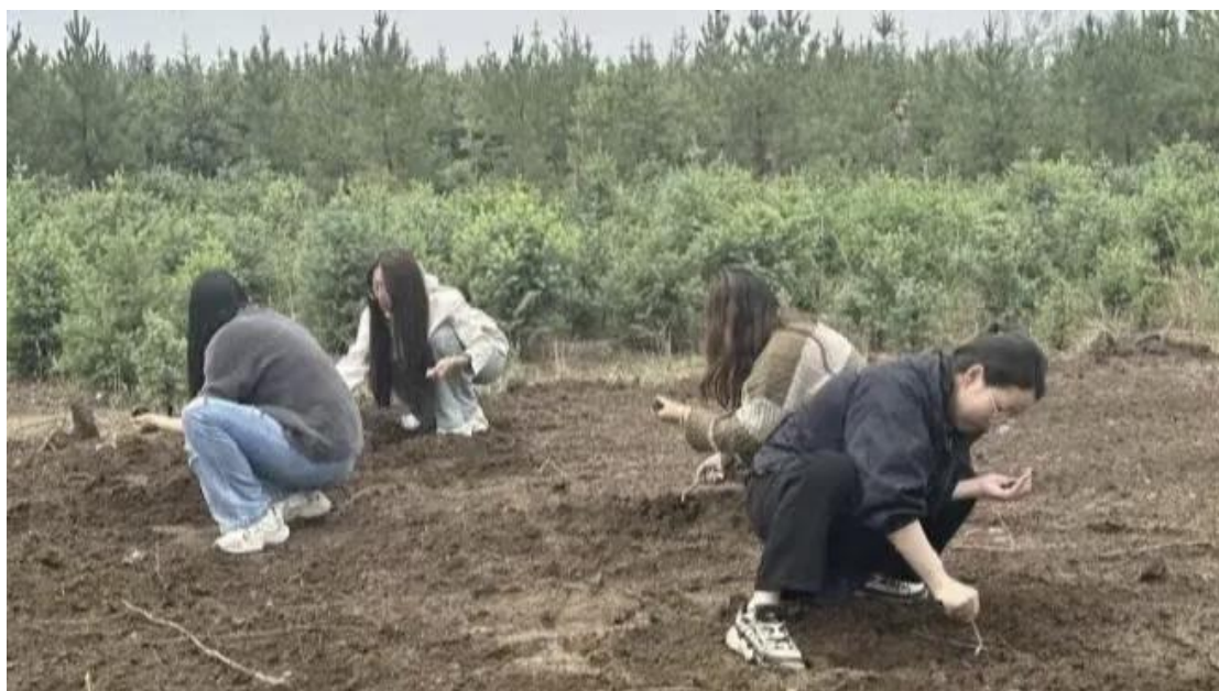
图 3-1 乔家营中药种植基地

体验了农民的辛勤劳动。将这种勤劳精神带入到日常工作和学习中，不断提高自身的综合素质和实践能力。