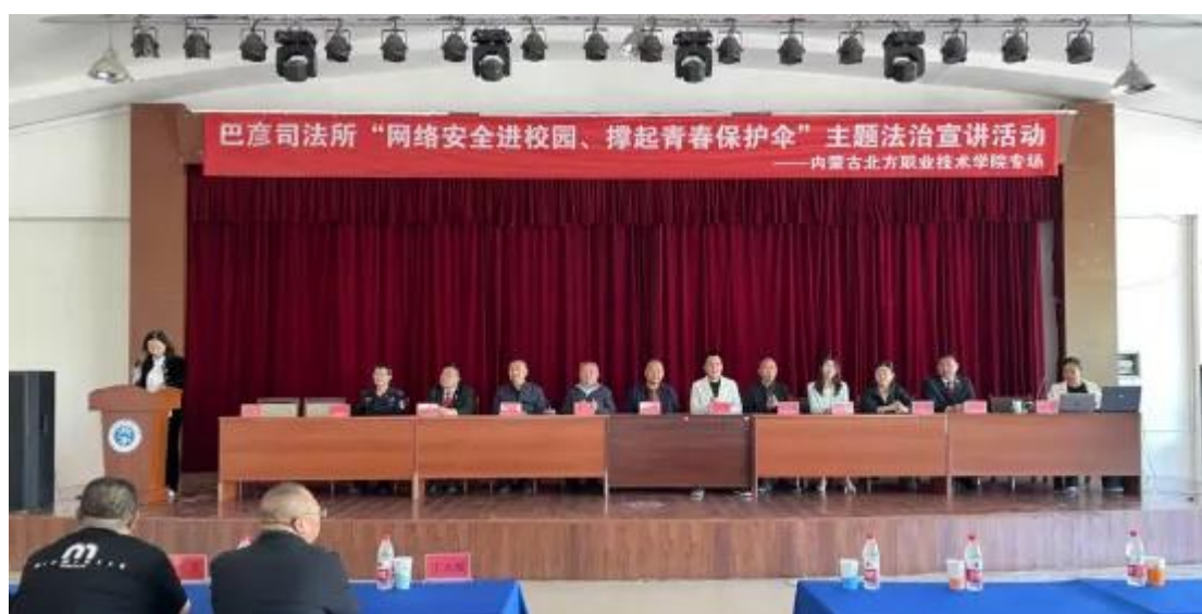
图 2-12 巴彦司法所来学校开展“网络安全进校园，撑起青春保护伞”主题法治宣讲活动

此次主题法治宣传活动，不仅让同学们对网络安全有了更深刻、更全面的认识，也为学校营造了健康、安全的网络环境。相信在巴彦司法所和学校等各方的共同努力下，同学们定能在网络世界中撑起坚实的青春保护伞，安全畅游、健康成长。