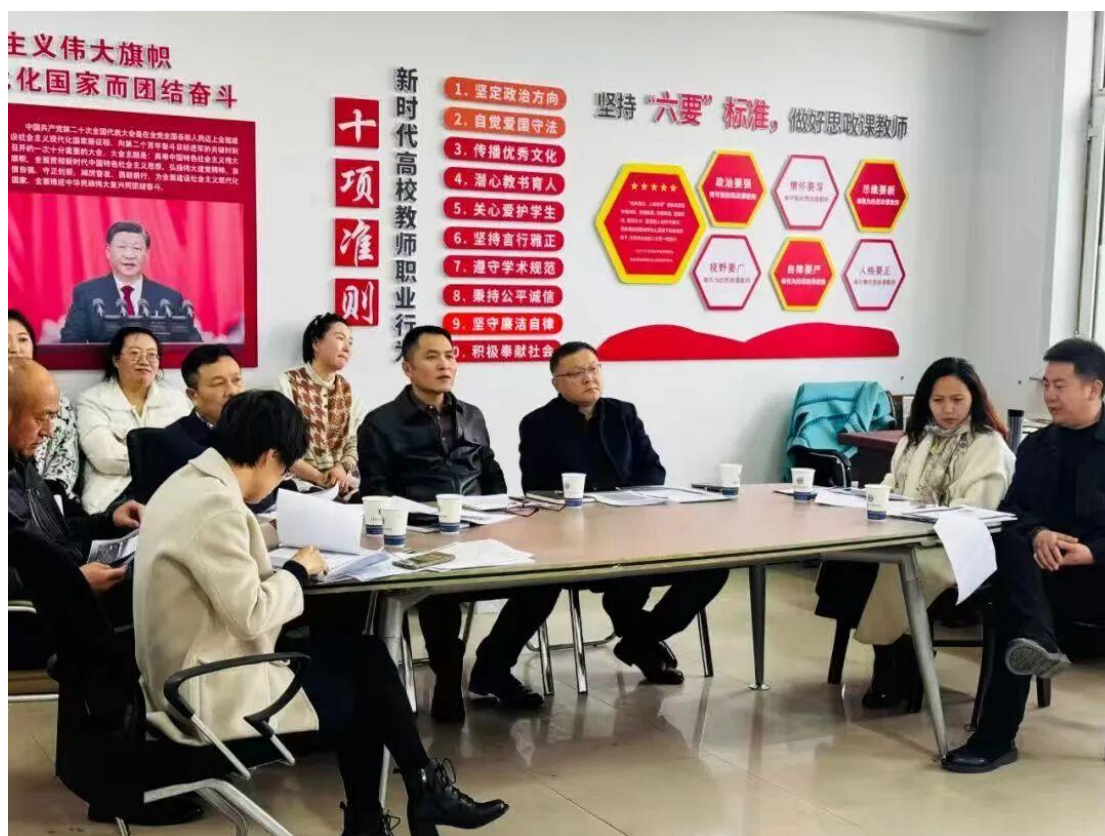
图 2-2 思政课教师集体备课