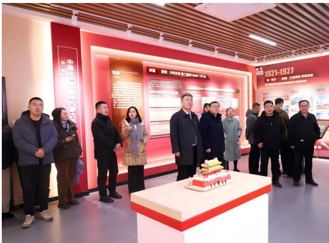
图 7-2 参观内蒙古电子信息职业技术学院研修基地考察交流