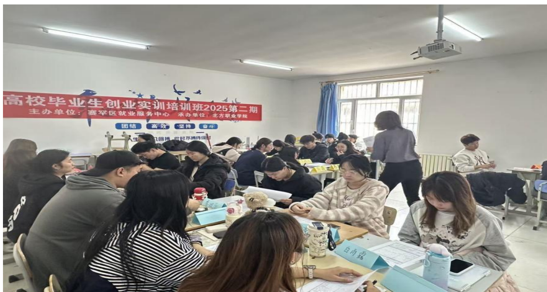
图 2-10 创业培训