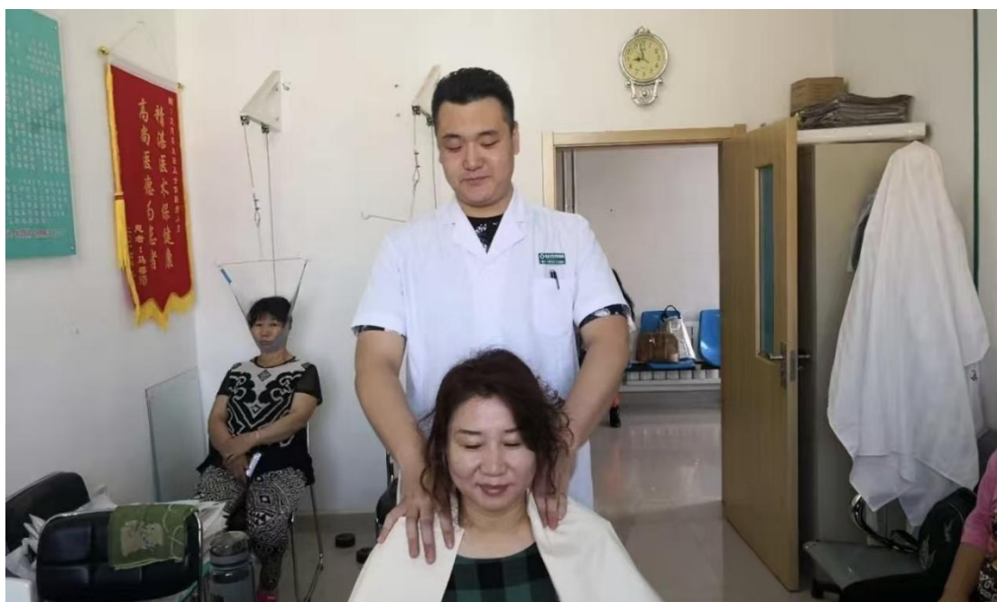
图 4-3 现场教学实操

复斟酌。这种对每一个病例都精雕细琢、追求极致康复效果的态度，让学生们深刻领悟到工匠精神的内涵。