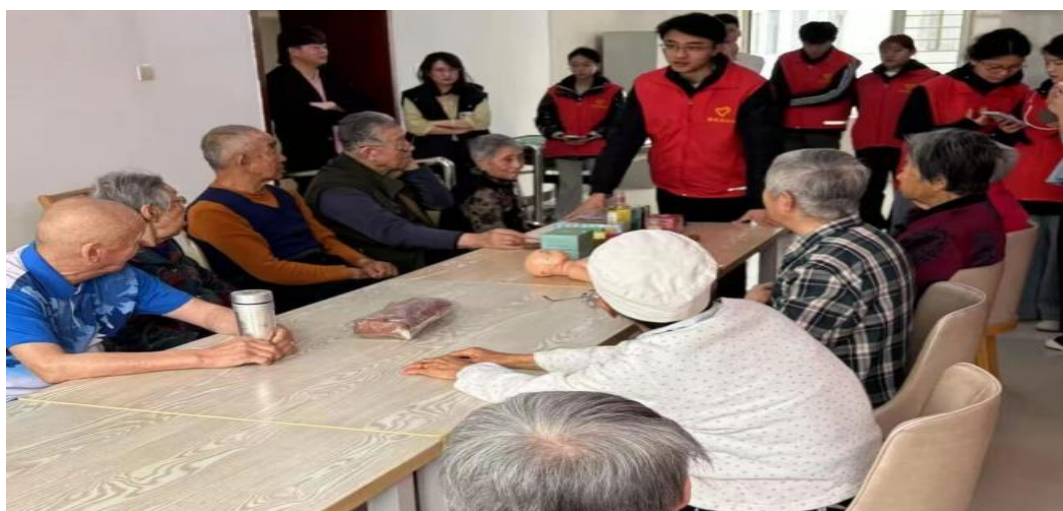
图 4-4 志愿者向老人讲解中医养生知识

的志愿活动，让更多人参与其中，为构建温馨，和谐的社会环境贡献一份力量，让每一个老年人都能在关爱中安享晚年。