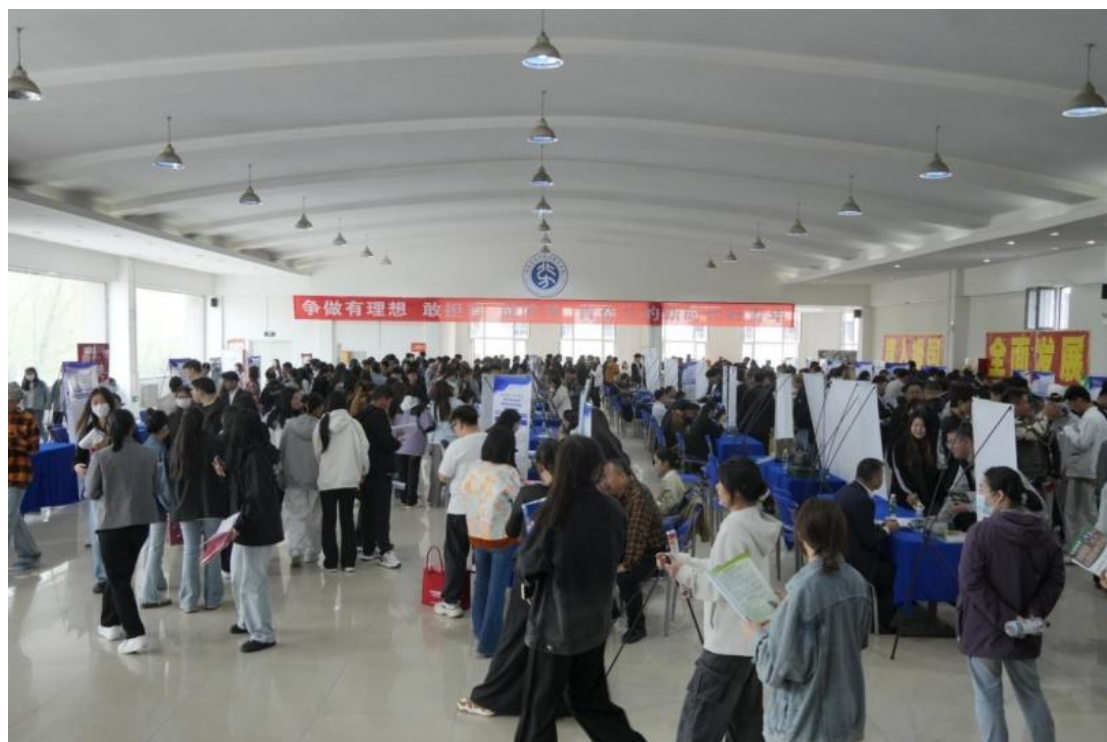
图 2-11 招聘会现场

除了线下的招聘会外，学校还精心组织6场网络招聘会，222家企业参与，提供987个岗位。通过线上线下结合的模式，满足不同专业、不同需求毕业生的就业期望，大幅提高就业匹配度，让毕业生有更多选择空间。