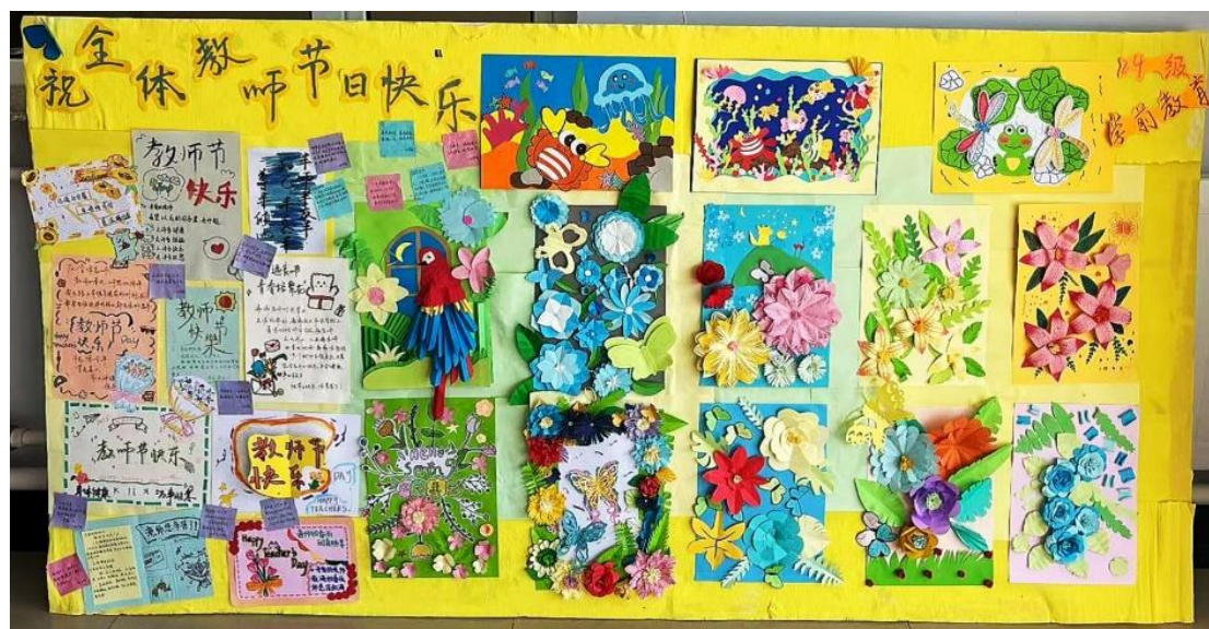
图 2-5 学生制作教师节展板

常态开展艺术活动。 不断优化“第二课堂”美育模块，发挥学生组织的主体作用，积极开展美育实践活动。学生会组织举办书画大赛、摄影大赛、文化长廊、影视赏析等活动，提升学生的审美和人文素养；以大学生艺术团为平台，举办高雅艺术进校园、爱国主义大课堂、大学生文化艺术节等大型文艺汇演，营造校园美育文化氛围；以学生社团为依托，开展传统文化、音乐、舞蹈、美术等多样化社团活动，促进艺术教育融合发展。