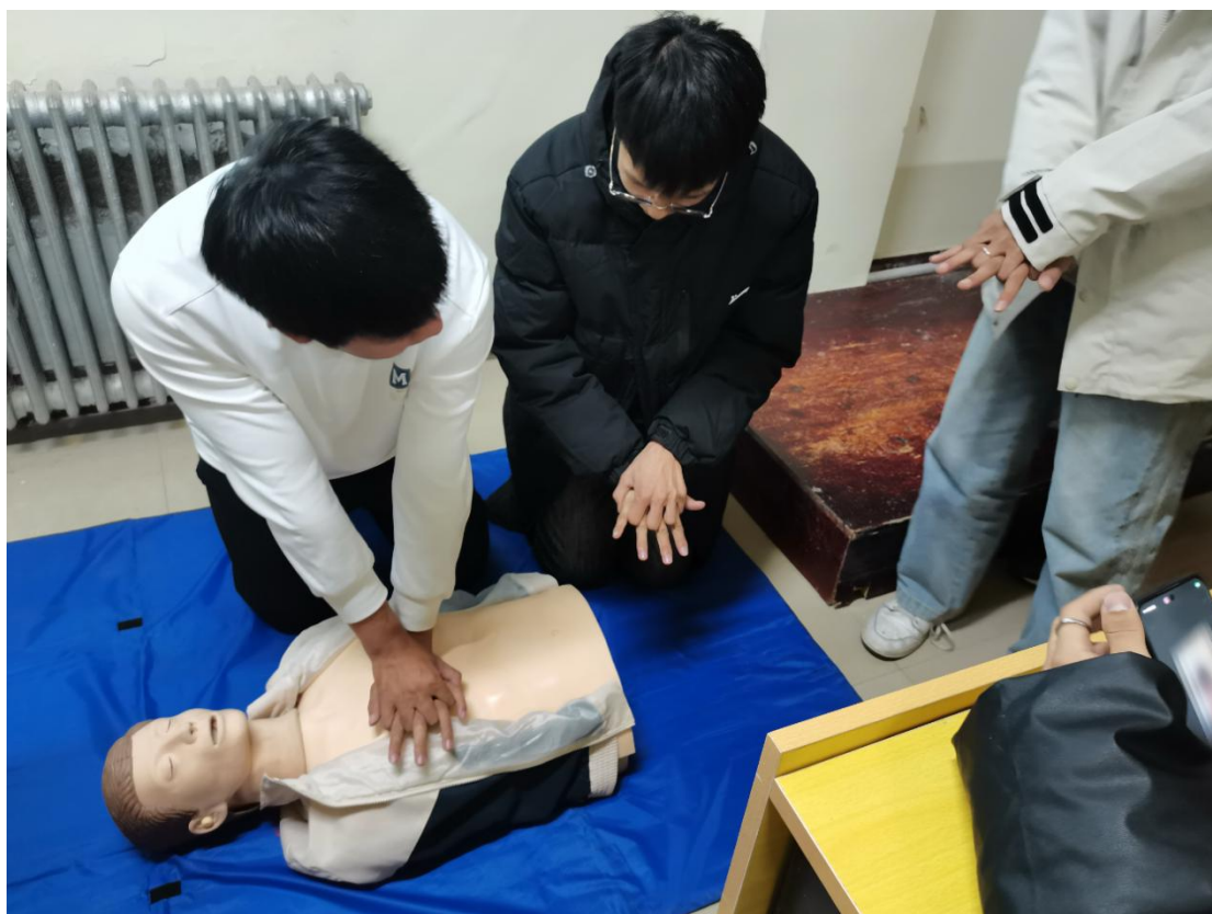
图 6-4 教师指导学生进行护理急救