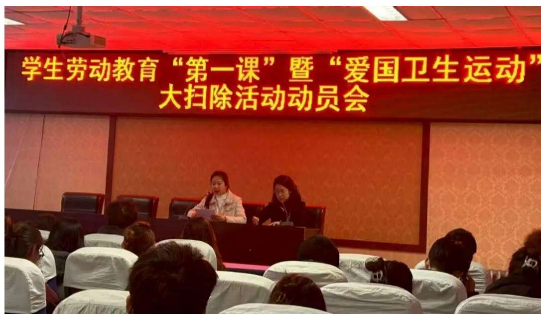
图 2-7 学生劳动教育“第一课”暨“爱国卫生运动”大扫除活动动员会

劳动教育融入育人评价体系。 深化综合素质评价改革，提升劳动教育比重，促进学生德智体美劳全面发展；完善学生劳动素养评价标准、程序及方法，强化劳动教育的组织实施，引导学生在劳动实践中实现自我教育与成长，以培养具备劳动精神和社会责任感的新时代人才。