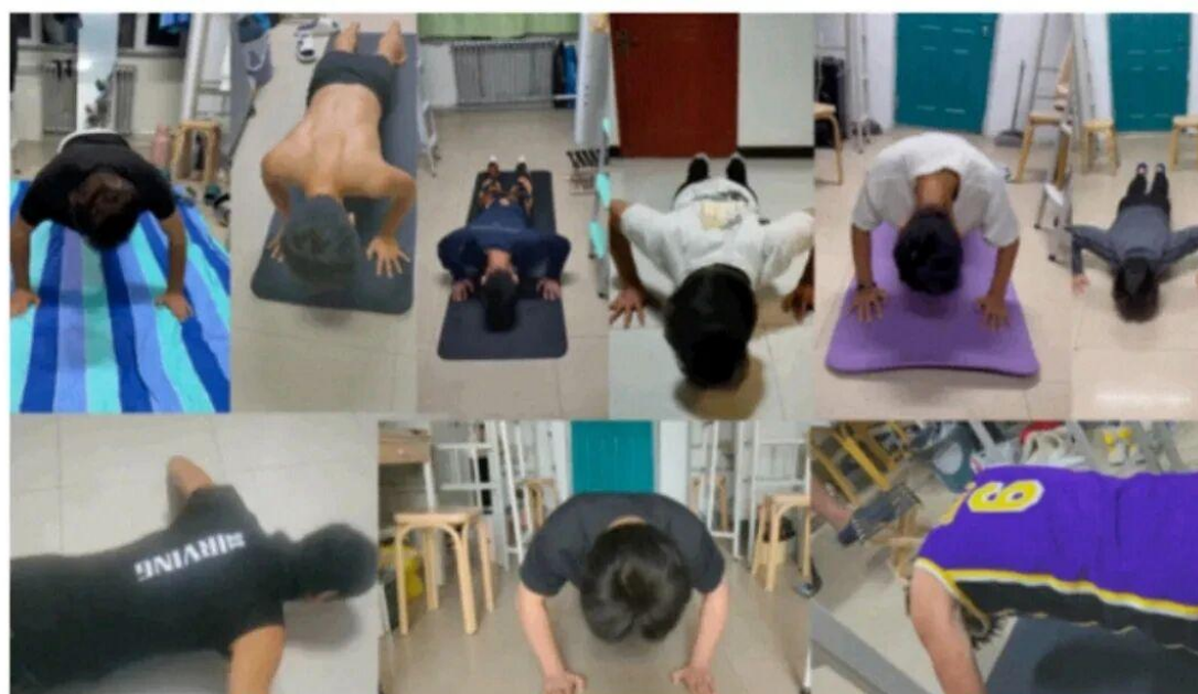
图 2-4 第二届宿舍俯卧撑锦标赛

按视频数量前15名晋级( 12日 )晚8 :00进入内蒙古北方职业技术学院晚会，届时学校周雪峰院长会“率先垂范”，通过现场的方式与各参赛同学“一决高下”，“一分钟俯卧撑”数量超过院长的前十名的同学会得到院长亲自派发的“读书基金”，带书领取！一人参赛全舍收益，所获读书基金，由全宿舍共同使用。