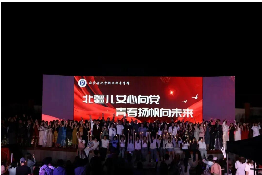
图 2-13 2025 年校园文化艺术节