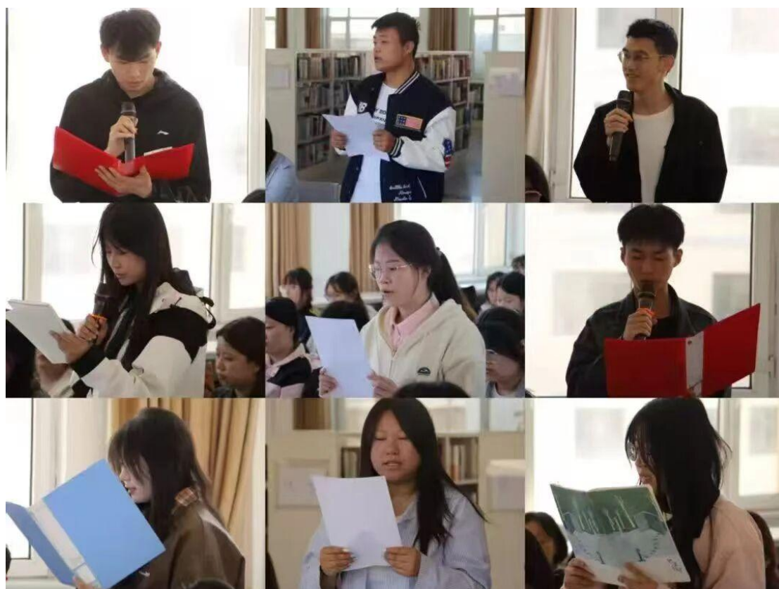
图 2-8 图书馆世界读书日读书分享会圆满落幕

同学们用自身经历和大家分享了读书的重要性，鼓励大家多读书，提高自己的阅读水平从而提高自身竞争力。争取从中华传统古籍中摄取更多的相关知识。