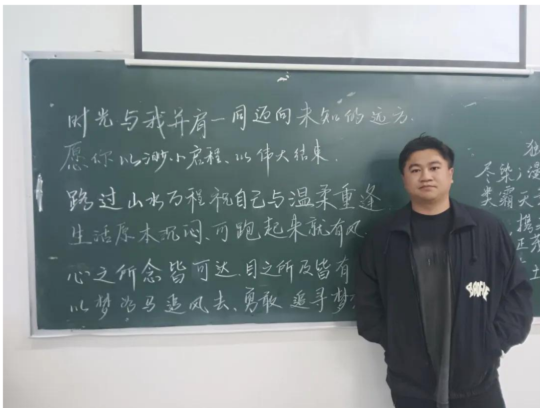
图 2-6 学校第一届书法比赛