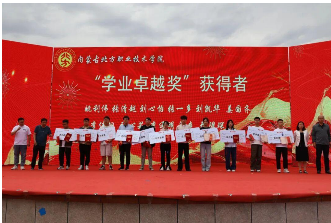
图 2-14 内蒙古北方职业技术学院 2025 专升本总结表彰大会圆满举行