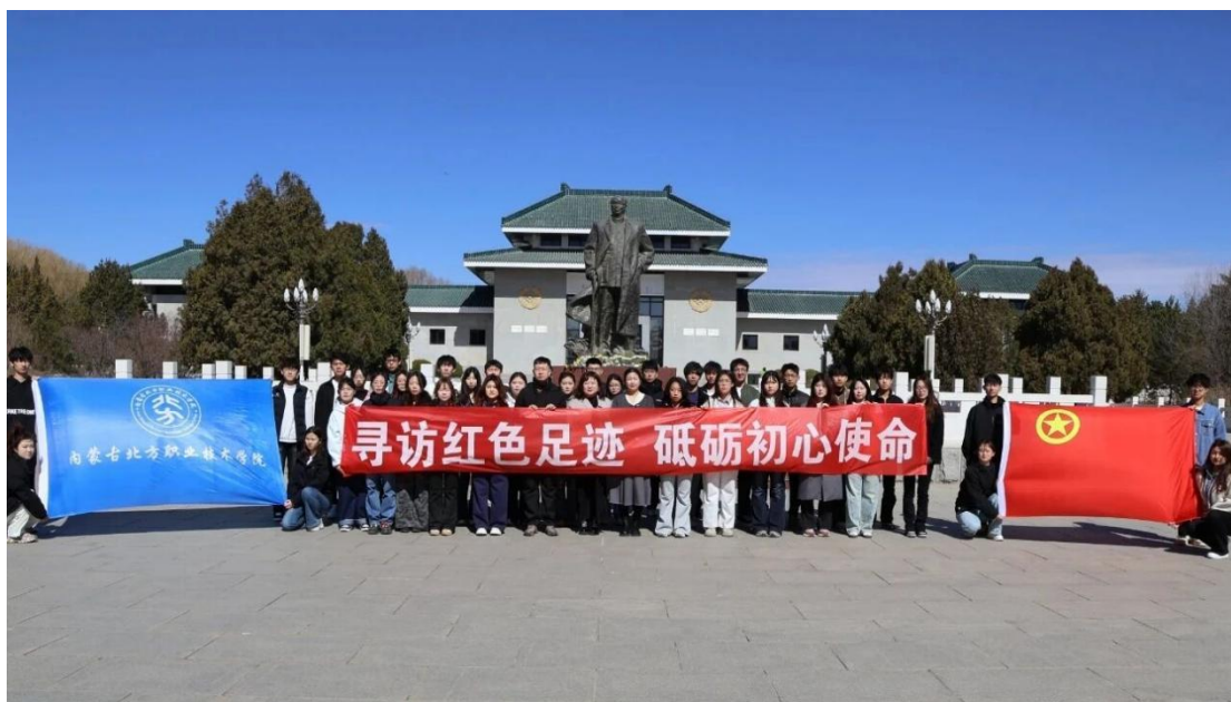
图 2-3 寻访红色足迹，砥砺初心

师打造有高度、有热度、有深度、有温度的思政课“教学神器”。打造线上精品思政微课，牢牢守好主阵地，营造时时可学，处处能学的浓厚氛围。大力推进智慧平台建设，构建由思政专题网站、掌上互动社区、指尖上微课堂、网络教育名师工作室等组成的网络思政教育体系，拓展“线上课堂”，让思政课“实”起来。