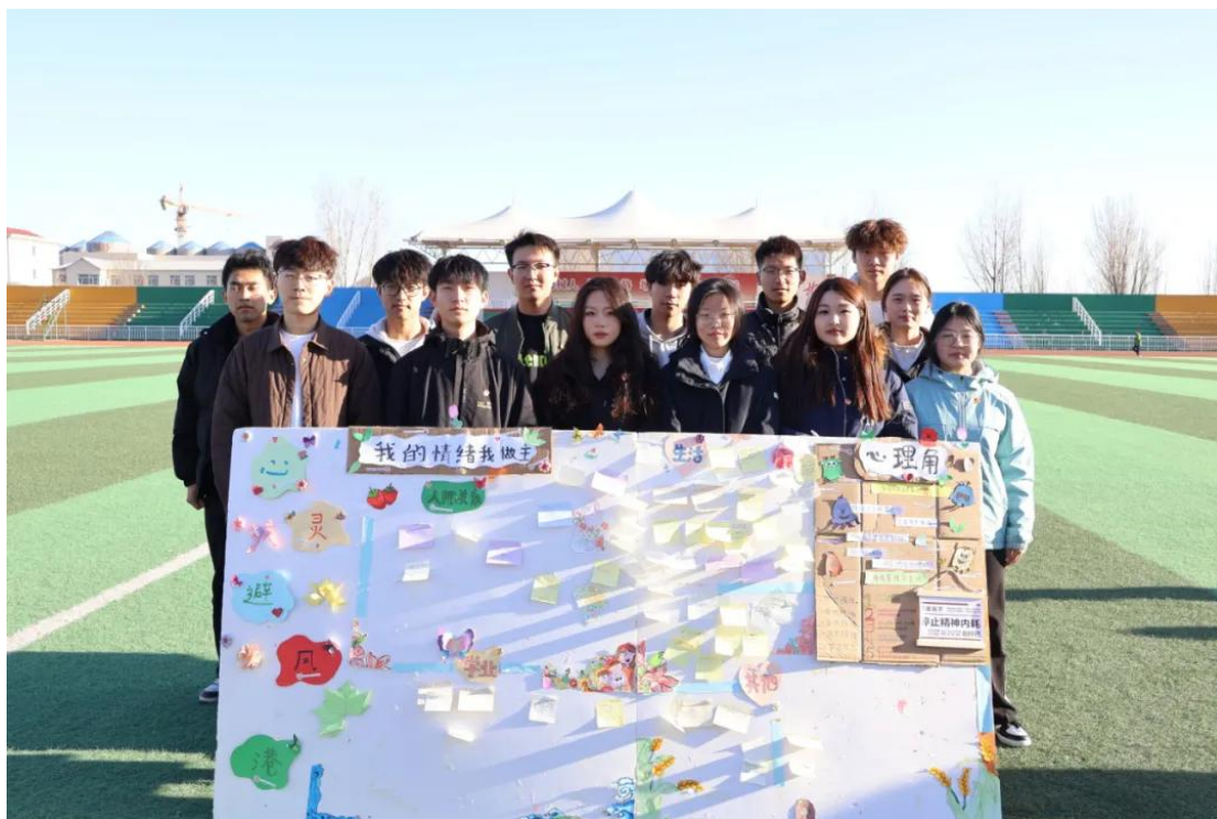
图 2-15 团委组织操场心理角活动