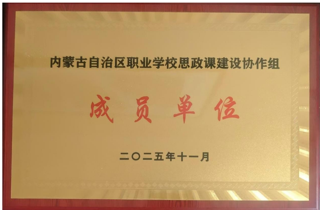
图 3-2 内蒙古自治区职业学校思政课建设协作组成员单位